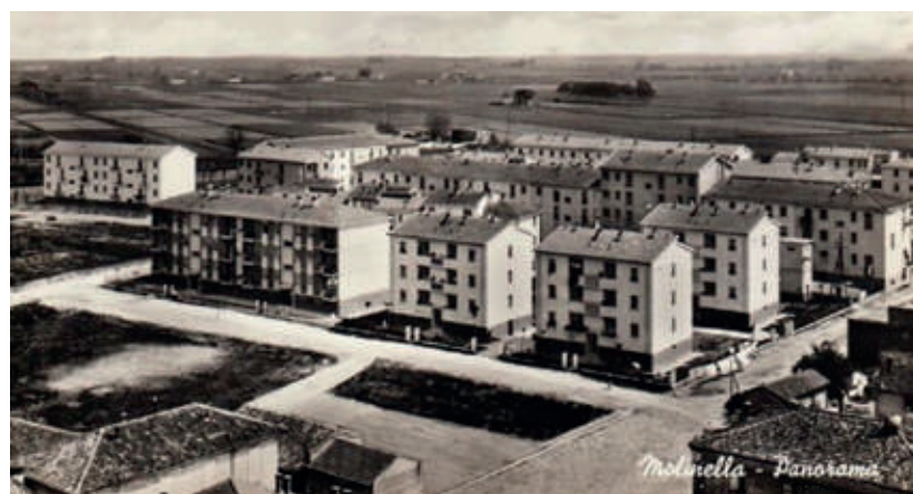
Molinella. Case popolari nell'area detta "legione straniera"

all'ulteriore sviluppo edilizio residenziale di Molinella e ad aprire un vero e proprio circolo virtuoso diffondendo nuova occupazione, più redditi e consumi beneficiando conseguentemente anche l'artigianato e il commercio locale. I primi anni '60 furono quindi gli anni del boom economico-sociale non solo a Molinella ma anche nell'Italia setten-