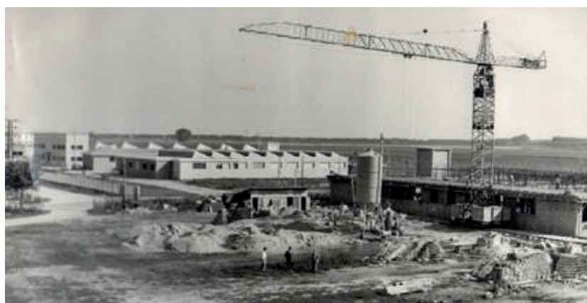
1960. Molinella apre le porte all'industrializzazione.

trionale. In seguito il processo di industrializzazione del Comune fece altri passi significativi con lo spostamento del canale "Annegale" e l'insediamento di tanti opifici artigianali (nei primi anni '70, soprattutto) per poi crescere ulteriormente oltre tale canale con l'insediamento di altre importanti realtà industriali (Diavia-Frigette, Anteo, Agrimaster, Fral, Ovako ecc.), alcune di valenza internazionale. Se in quel periodo Molinella fosse stata meglio collegata ai caselli autostradali o alle maggiori e più scorrevoli arterie stradali, altre industrie si sarebbero sicuramente insediate nella nostra area produttiva. Ma questa aspettativa fu purtroppo ignorata dagli organi preposti alla viabilità.