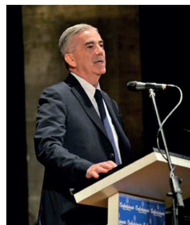
Pres. Conf. Marco Granelli

mo per le aziende dell'area che porta ad un positivo confronto con le istituzioni.