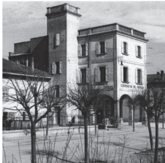
La sede della Cooperativa Agricola "G. Massarenti"

Lega dei Braccianti delle Organizzazioni Operaie di Molinella e nelle agitazioni del 1914, 1919 e 1920, nonché socio della allora Coop.