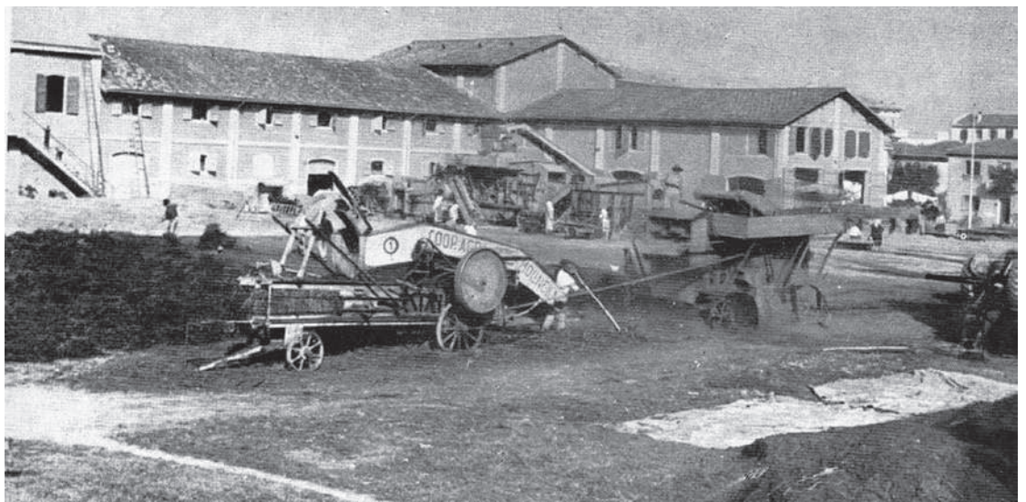
Lavori sull'aja presso la Tenuta Centrale della Coop. Agricola G. Massarenti.